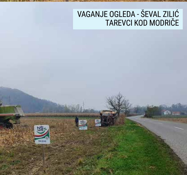
VAGANJE OGLEDA - ŠEVAL ZILIĆ TAREVCI KOD MODRIČE