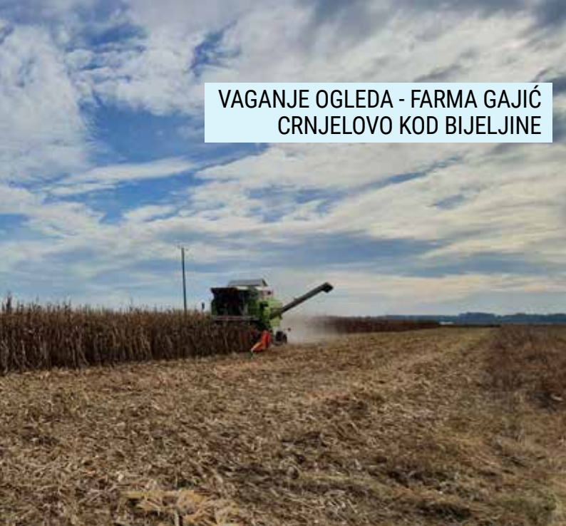
VAGANJE OGLEDA - FARMA GAJIĆ CRNJELOVO KOD BIJELJINE