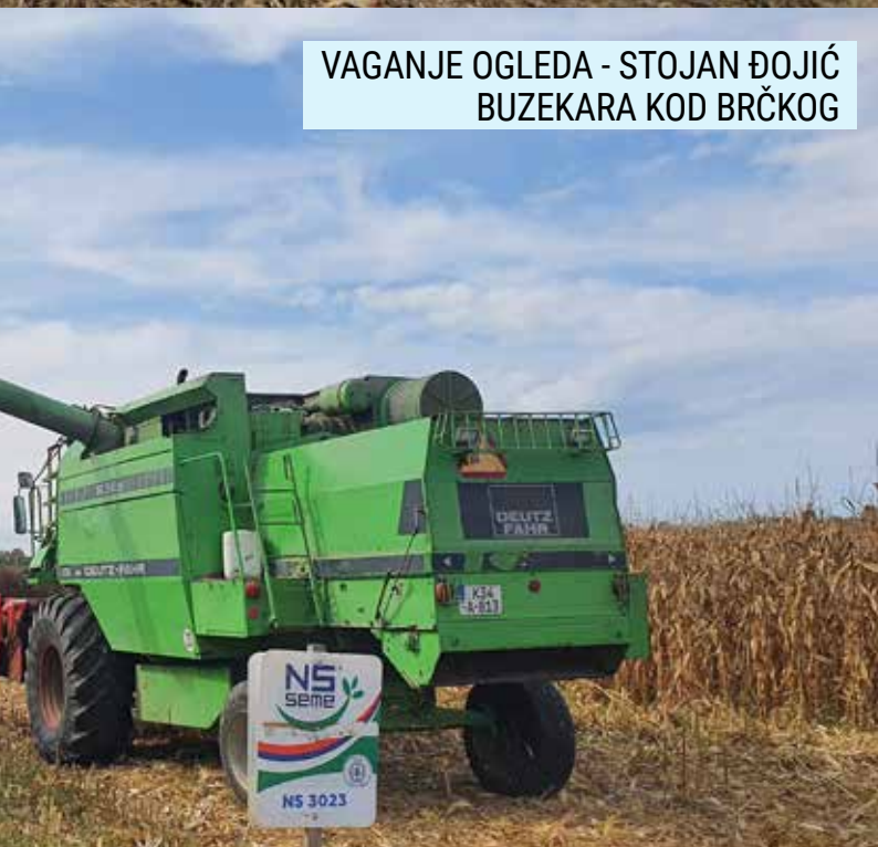
VAGANJE OGLEDA - STOJAN ĐOJIĆ BUZEKARA KOD BRČKOG